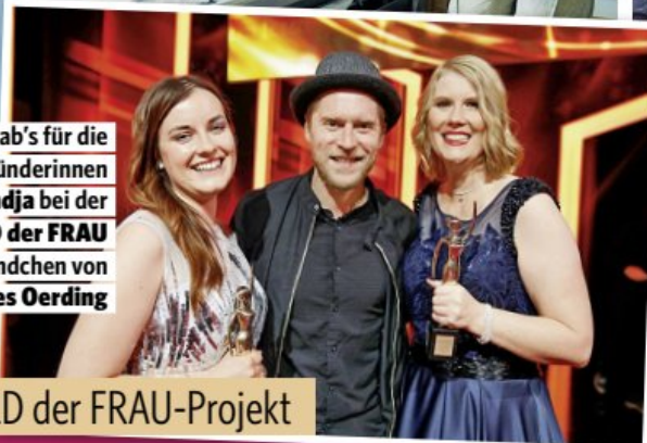
GOLDENE BILD der FRAU-Projekt