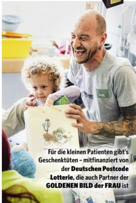
Für die kleinen Patienten gibt's Geschenktüten – mitfinanziert von der Deutschen Postcode Lotterie , die auch Partner der GOLDENEN BILD der FRAU ist